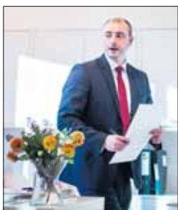
LITE FLEKSIBEL: Ministeren lytter kun til egne eksperter.

Klassekampen honorerer normalt ikke innsendt stoff. Innsenderens e-postadresse blir trykt med mindre innsenderen reserverer seg mot dette.